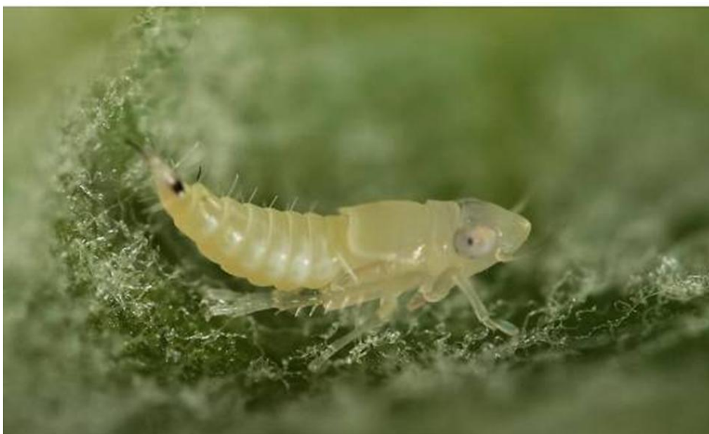
L3-as fejlettségű lárva

Maga a kártevő nem karantén besorolású , csak a betegség (arany színű sárgaság fitoplazma), amit terjeszt.