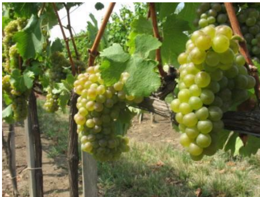
A meteorológiai állomások által mért adatok

Az idei évben szép a szőlő, jó évjárat ígérkezik minden tekintetben. Mindenkinek jó Szüretet, szép Borokat kívánunk!